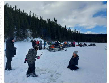
Jeux franco-labradoriens >>voir p2