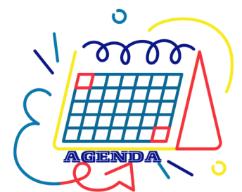
Agenda des activités >>voir p4

Le premier camp justice pour les jeunes francophones de la province aura lieu à St-Jean du 25 au 27 mars 2024. Ce projet est une initiative de Franco-Jeunes et du Réseau justice en français de TNL. Ce projet peut être qualifié de « projet pilote ». Une belle initiative qui rassemblera des jeunes de toute la province mais aussi des jeunes de Saint-Pierre-et-Miquelon. Franco-Jeunes et le Réseau justice en français de TNL sont reconnaissants de l'intérêt porté par VOGM à ce projet. (Article disponible en anglais en cliquant sur l'image ci-contre).