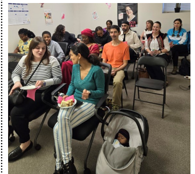
Journée de la Femme à Compas >>voir p3